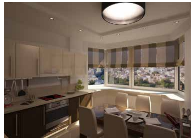
Фото и рисунки: Кристина Афанасенко.

Детские комнаты сделаны – с учётом пожеланий для каждого ребенка, по их интересам и предпочтениям.